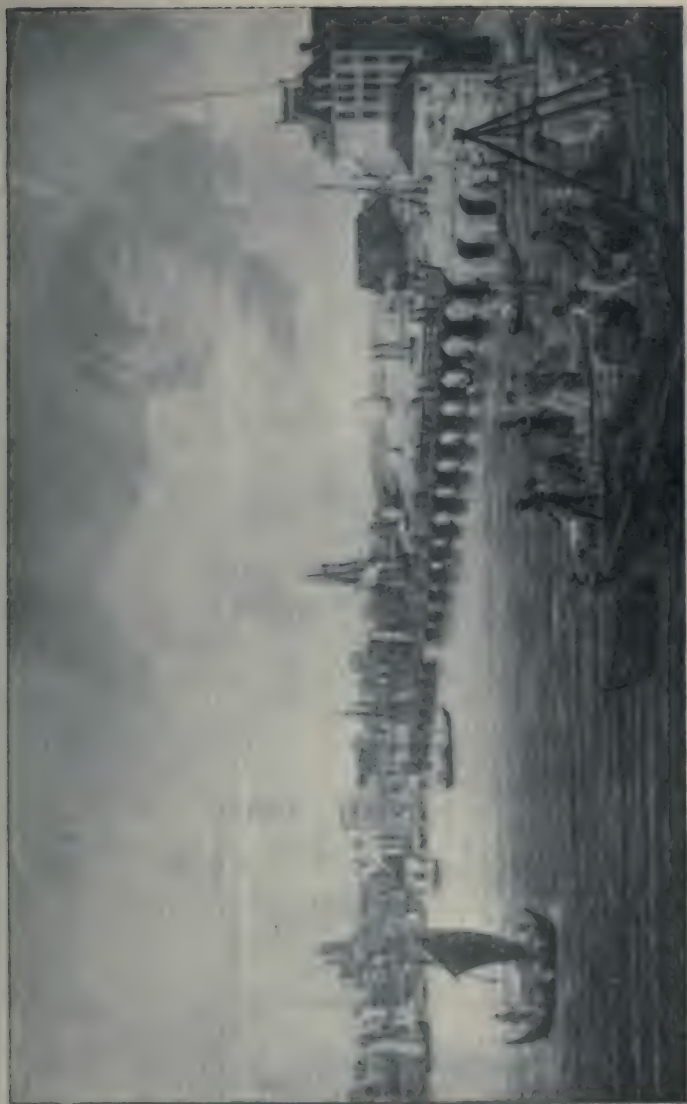
Vue du Port de Bayonne.

Tableau et gravure de Garneray. (Bibliothèque Nationale, Estampes.)